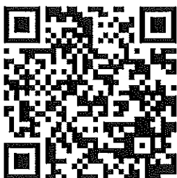
生命橋樑簡介影片

邀請符合條件的你、妳申請生命橋樑獎助學計畫，共同成就這一項以服務精神應用於事業及社會的扶輪計畫。